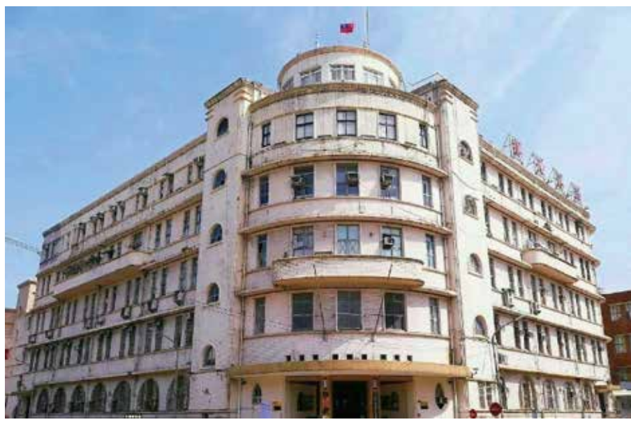
基隆海港大樓是基隆保存良好的日據時代建物之一