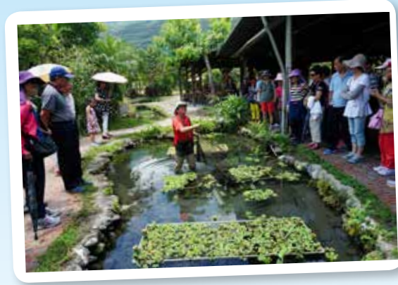
馬太鞍濕地生態園區導覽