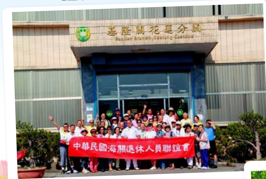
我們路過花蓮分關，問候一聲，辛苦了！