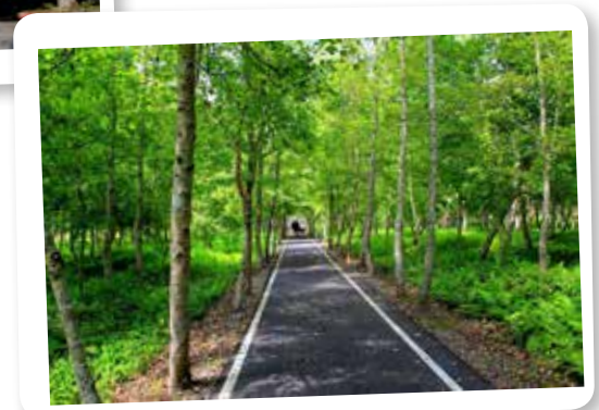
十年有成的大農大富平地森林園區

海子說：生命中有很多東西，能忘掉的叫過去，忘不掉的叫記憶；一個人的寂寞，有時候，很難隱藏得太久，時間太久了，人就會變得沉默，那時候，有些往日的情懷，就找不回來了。或許，當一段不知疲倦的旅途結束，只有站在終點的人，才會感覺到累，其實我一直都明白，能一直和一人做伴，實屬不易。