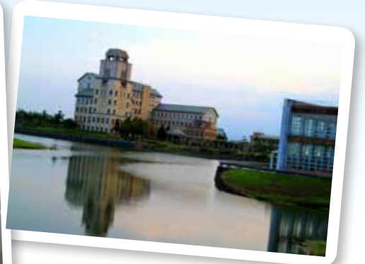
東台灣最美麗的大學 ----- 東華大學