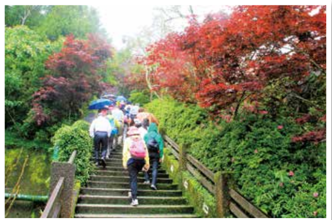
▲ 從停車場拾階而上，兩旁槭樹一片火紅。