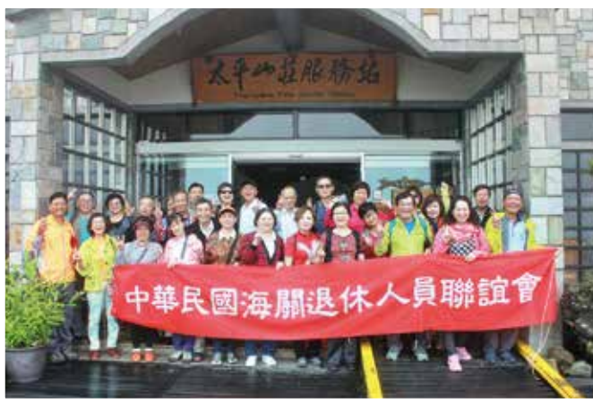
▲ 退休人員在太平山莊服務站前合照。