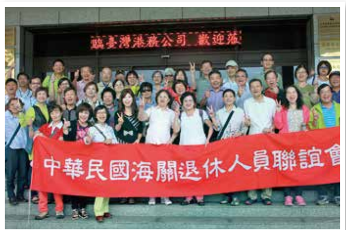
▲ 路過蘇澳，順道參訪花蓮分關蘇澳派出課。