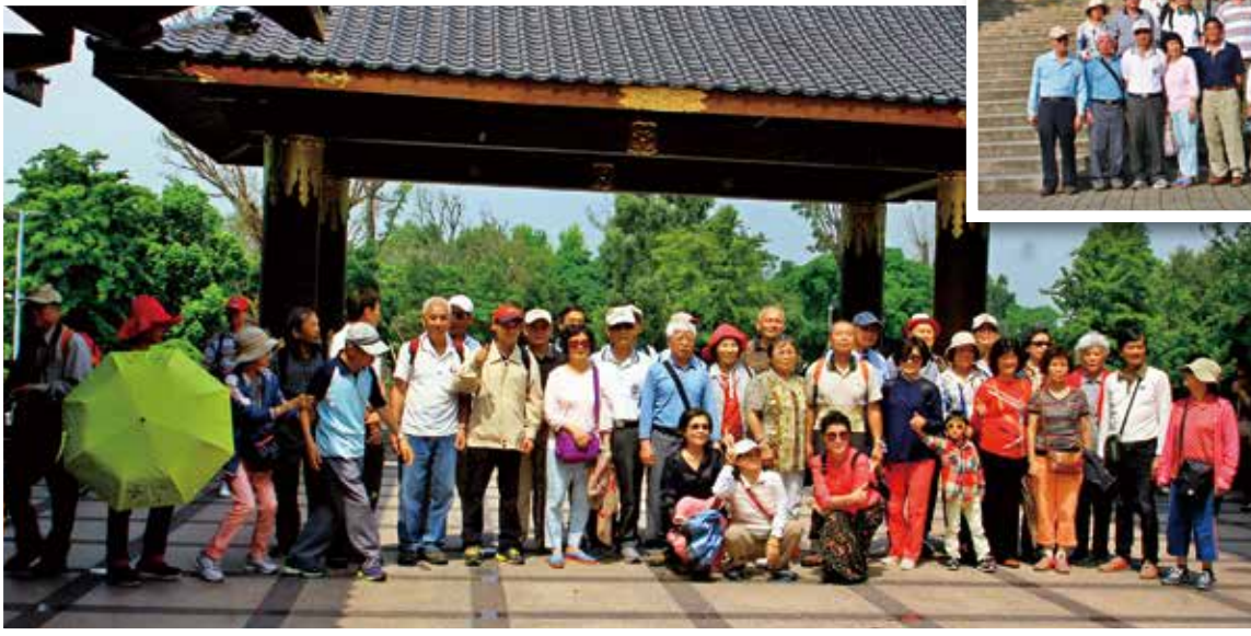
▲ 彰化溪州萬景藝苑