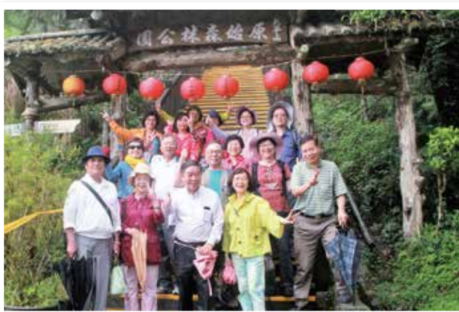
▲ 太平山海拔近 2000 公尺，動植物生態資源豐富。