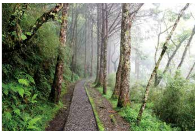
▲ 步道空氣清新，鋪上碎石容易行走。