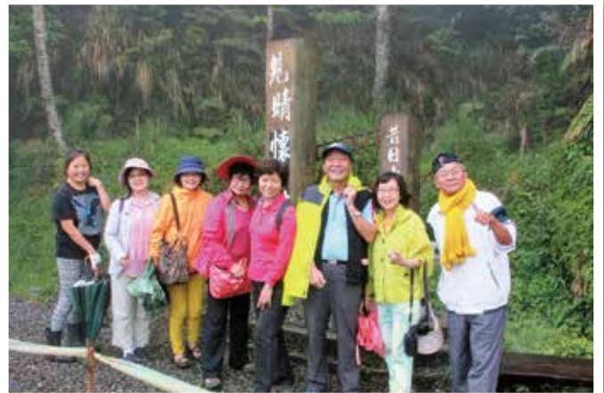
▲ 在見晴懷古步道（昔日山地運材軌道）入口留影。