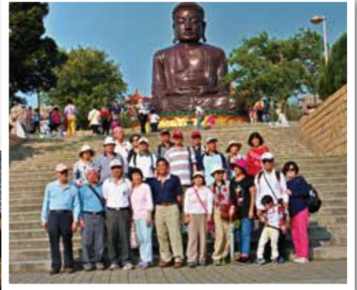
▼ 八卦山大佛風景區