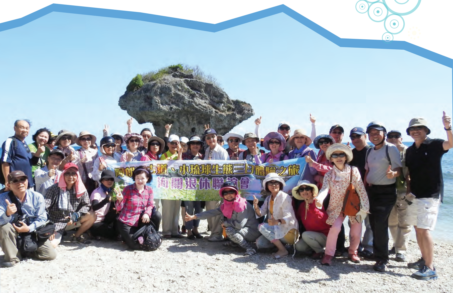
■海關退休人員聯誼會旅遊活動人員2018年5月16日在小琉球花瓶岩前合影

註：您收到海關代發之銓敘部處分書後，必需於30天內至郵局寄出復審書（以郵戳日期為憑），方有實質效力。