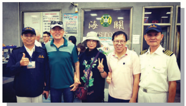
作者與海關同仁合攝於金門小三通通關現場

如果哪天，瘟疫遠離，春回大地，記得這樣的自覺，珍惜健康，保有善良與真誠，好好地單純生活，不止是虛擬網路，而是真實人間。