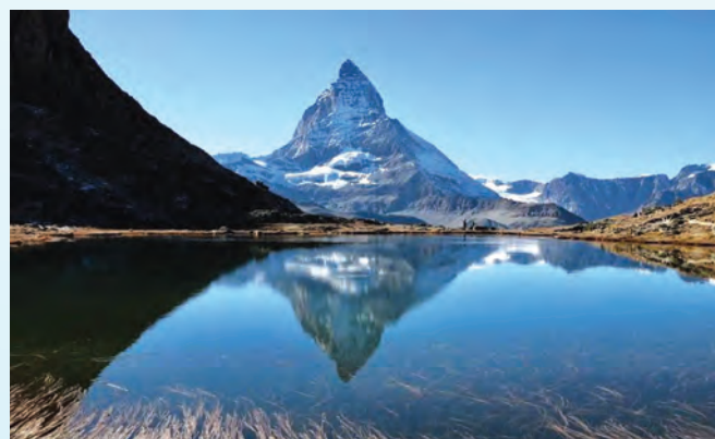
▲湖光山色為五湖步道增添許多美麗

用餐完，下坡往史坦利湖(Stellisee)走去，路好走多了。在策馬特山區環繞著五個湖泊健行，處處可見湖中高山的倒影，令人心曠神怡。其實在瑞士許多地區的美比起五湖步道並不遜色，車行過茵特拉根(Interlaken)或是開往藍湖(Blausee)，四周針林散布在青綠的山坡上，農舍與牛群交疊的圖像，都呈現出瑞士山區獨特的美，但是那裏沒有馬特洪！缺少了馬特洪，很難補滿來自全世界遊客對一個獨特景點的歌謠。當疫情歇止，趁著還能健走，我們相約再去。