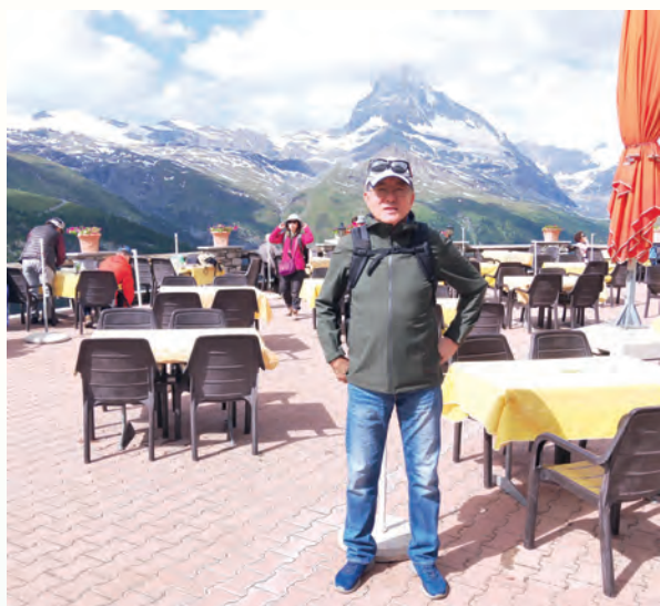
▲在Sunnega纜車待轉區設有精緻的觀景台

勞賀德(Blauherd)，一般健行五湖，都由此出發。至於想冬天滑雪、夏天滑翼的遊客，可在此續搭大型纜車上鹿特峰樂園(Rothorn Paradise)。