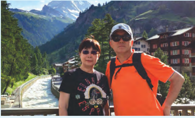
▲一條湍溪穿鎮而過，兩旁房舍卻填滿瑞士風格的高雅

走遍整個小鎮，花不了多長時間，安步當車，是遊覽策馬特的最佳方式。把觀光客拉上馬特洪山各個「樂園」的兩條纜車站和一條上山火車站就坐落在這條大約只有2000多公尺的街道上。我到策馬特是7月初，正是歐洲的旅遊旺季，路上形形色色的各國觀光客不一而足，卻完全沒有九份的壅塞與墾丁的雜沓，不禁對這個小鎮發展觀光的成熟與精緻讚嘆不已！