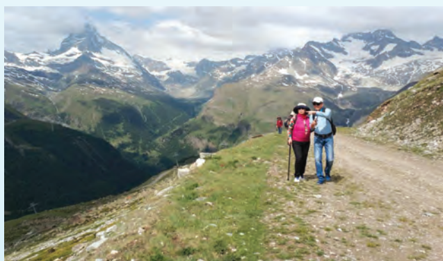
▲從Blauherd走登山步道有挑戰性

出了Blauherd纜車站，湖景路線從1點鐘方向出發，至於前面提到的健行路線是走山景爬坡路11點鐘方向，這兩條路線都會匯歸於佛拉荷(Fluhalp)一家我的兒女們都曾住過的山中旅館Pollux。上坡山道是沿著往Rothorn樂園的側山邊坡一路上行大約300多公尺，路好走，但坡度頗大，幸好有 Nordend冰山和Findelgletscher冰川在右側一路伴隨，可以稍解爬坡的辛苦。