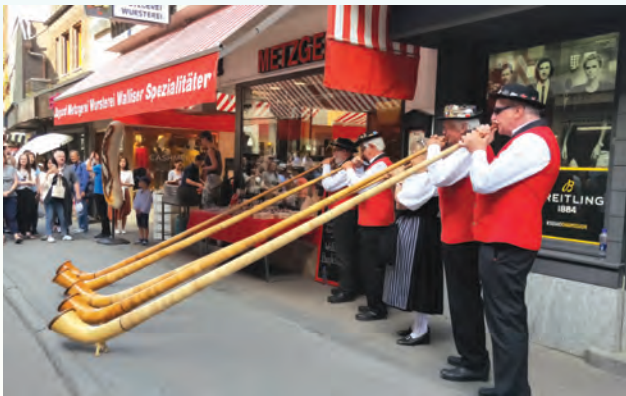
▲閒逛策馬特商業大街時，巧遇吹奏瑞士傳統長號表演

走遍整個小鎮，花不了多長時間，安步當車，是遊覽策馬特的最佳方式。把觀光客拉上馬特洪山各個「樂園」的兩條纜車站和一條上山火車站就坐落在這條大約只有2000多公尺的街道上。我到策馬特是7月初，正是歐洲的旅遊旺季，路上形形色色的各國觀光客不一而足，卻完全沒有九份的壅塞與墾丁的雜沓，不禁對這個小鎮發展觀光的成熟與精緻讚嘆不已！