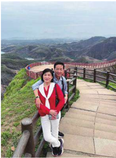
▲ 作者與夫婿攝於高椅嶺