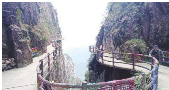
▲ 莽山國家森林公園幽谷一隅