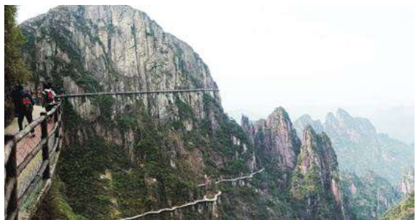
▲ 莽山國家森林公園懸空棧道

尤其是當我漫步在平緩的懸空棧道上，欣賞無敵美景時心裡想著：能在海拔1400公尺以上落差又極其大的崎嶇山谷間建造了這座長達8公里綿延不絕的懸空棧道，是何等艱鉅偉大的工程啊！不禁讓我對這些付出心力建造的工程人員們肅然起敬！