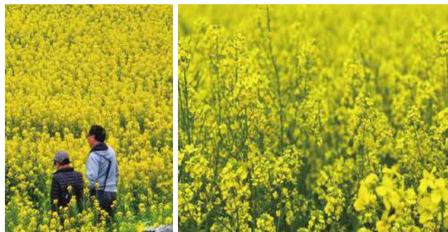
▲ 於前往高椅嶺的途中遇見的金色花海(油菜花田)

當我們前往高椅嶺的途中，沿途看到的竟是一片片黃澄澄的油菜花田，讓人目光為之一亮！貼心的小劉領隊特別商請司機先生停在路邊讓我們下車並零距離的在花田裡恣意拍照；人說「數大便是美」！真是怎麼拍，便怎麼美！此時照相聲、歡笑聲此起彼落，真希望此刻的歡樂永遠佇留！